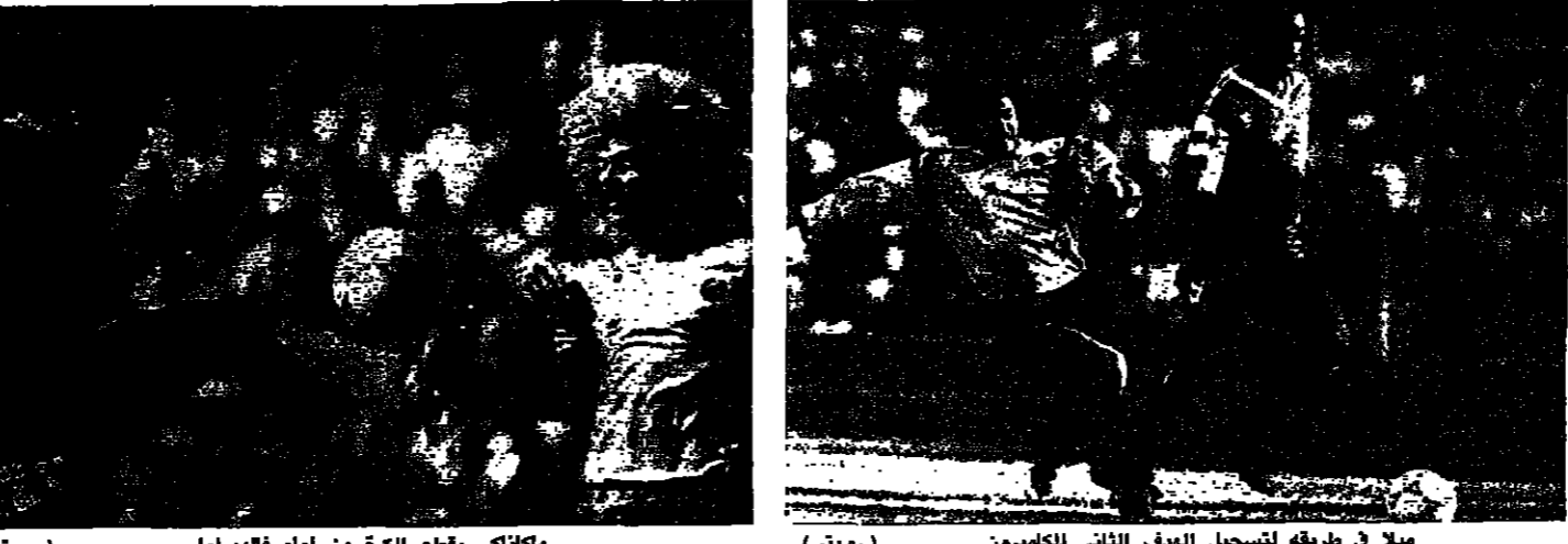
ميلا في طريقه لتسجيل الهدف الثاني للكاميرون (رويدر)